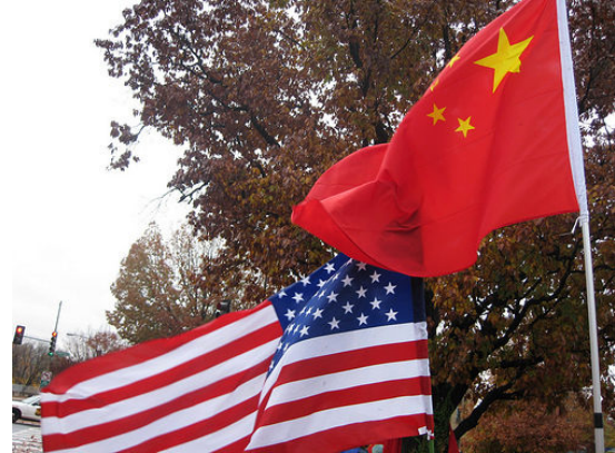
米中国旗=CC BY /futureatlas-com