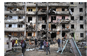
砲撃を受けたウクライナの集合住宅 = 2月25日、キエフ郊外

他方、キエフに住む知人をはじめ、ウクライナの愛国者たちの反ロシア感情は根深い。ウクライナの悲願と